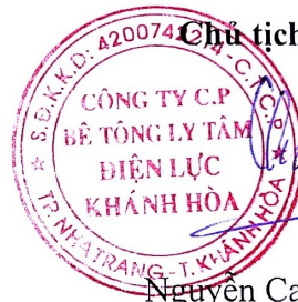
Nguyễn Cao Ký